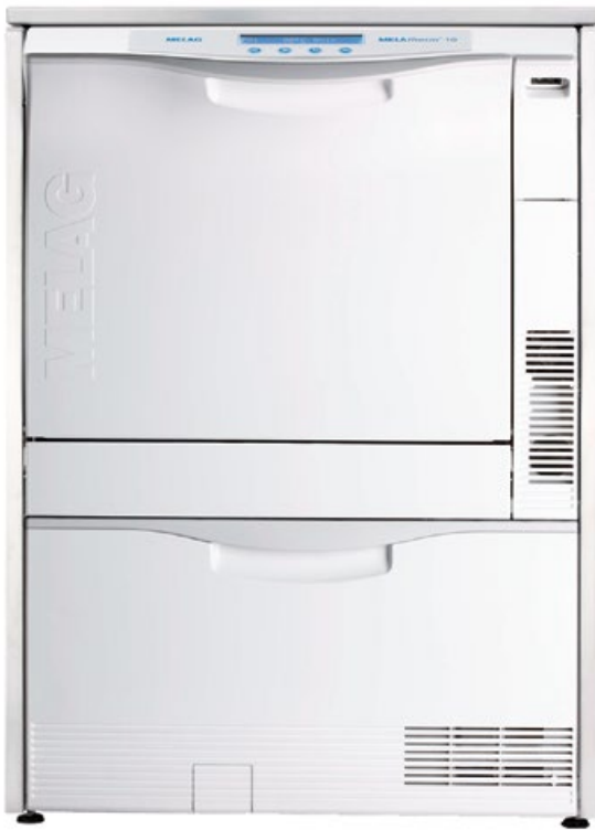
MELAtherm® Instrumente RKI-konform maschinell reinigen, desinfizieren und trocknen.