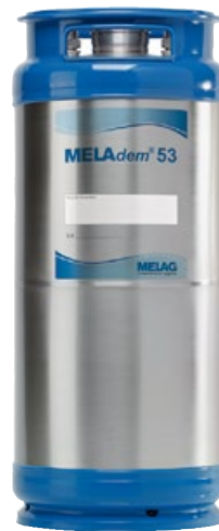
MELAdem®53 Wasseraufbereitung zur Versorgung von Autoklav und MELAtherm®.