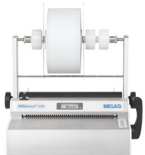
MELAseal®200 Validierbares Siegelgerät nach EN ISO 11607-2.